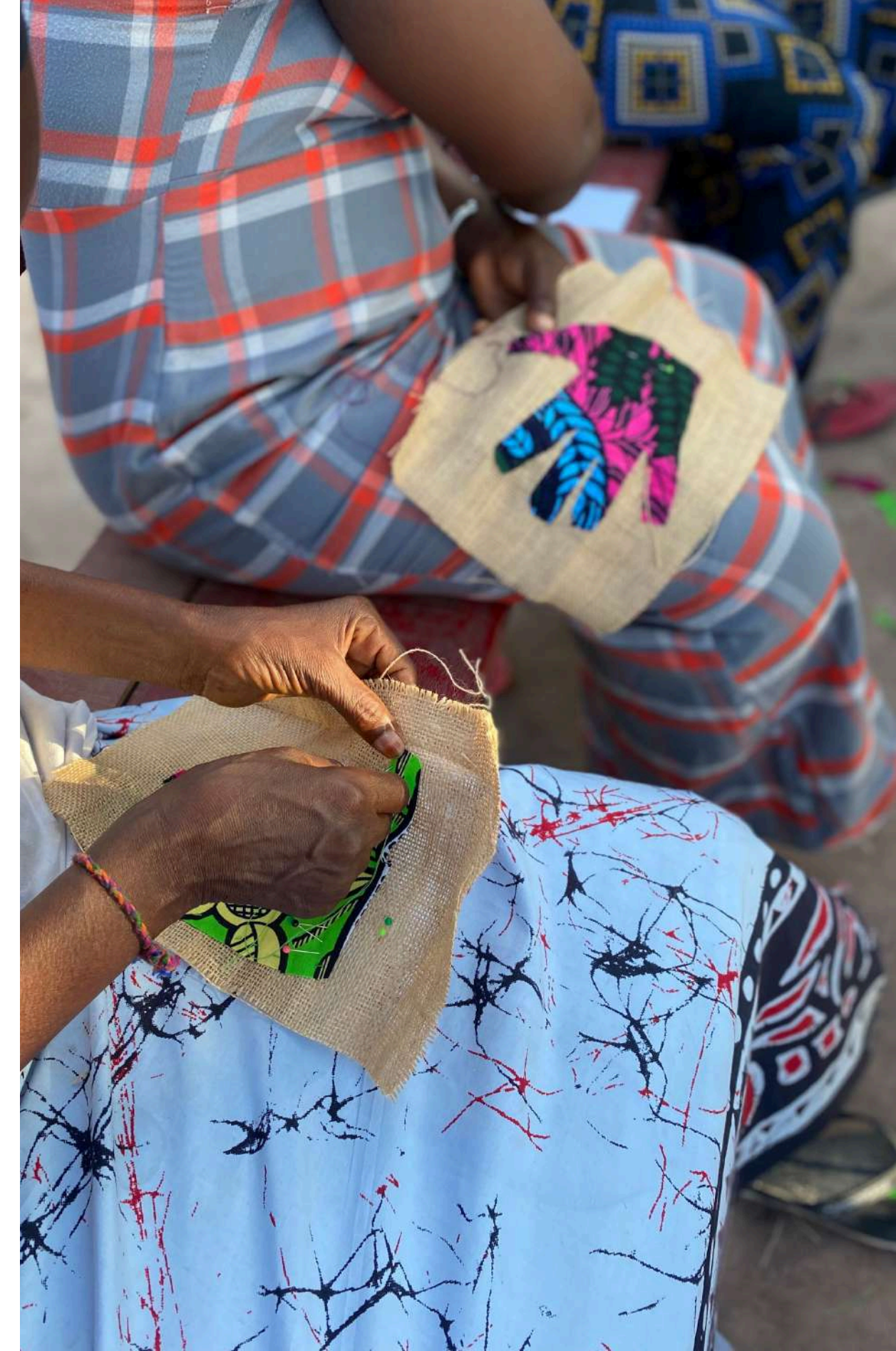
les mans africaines