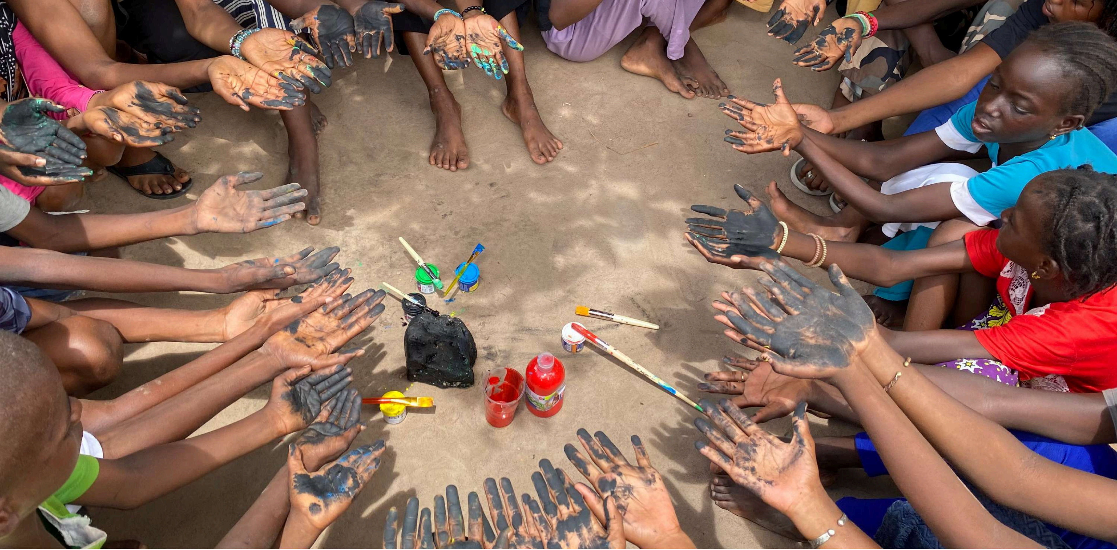
el "totem" del diàleg