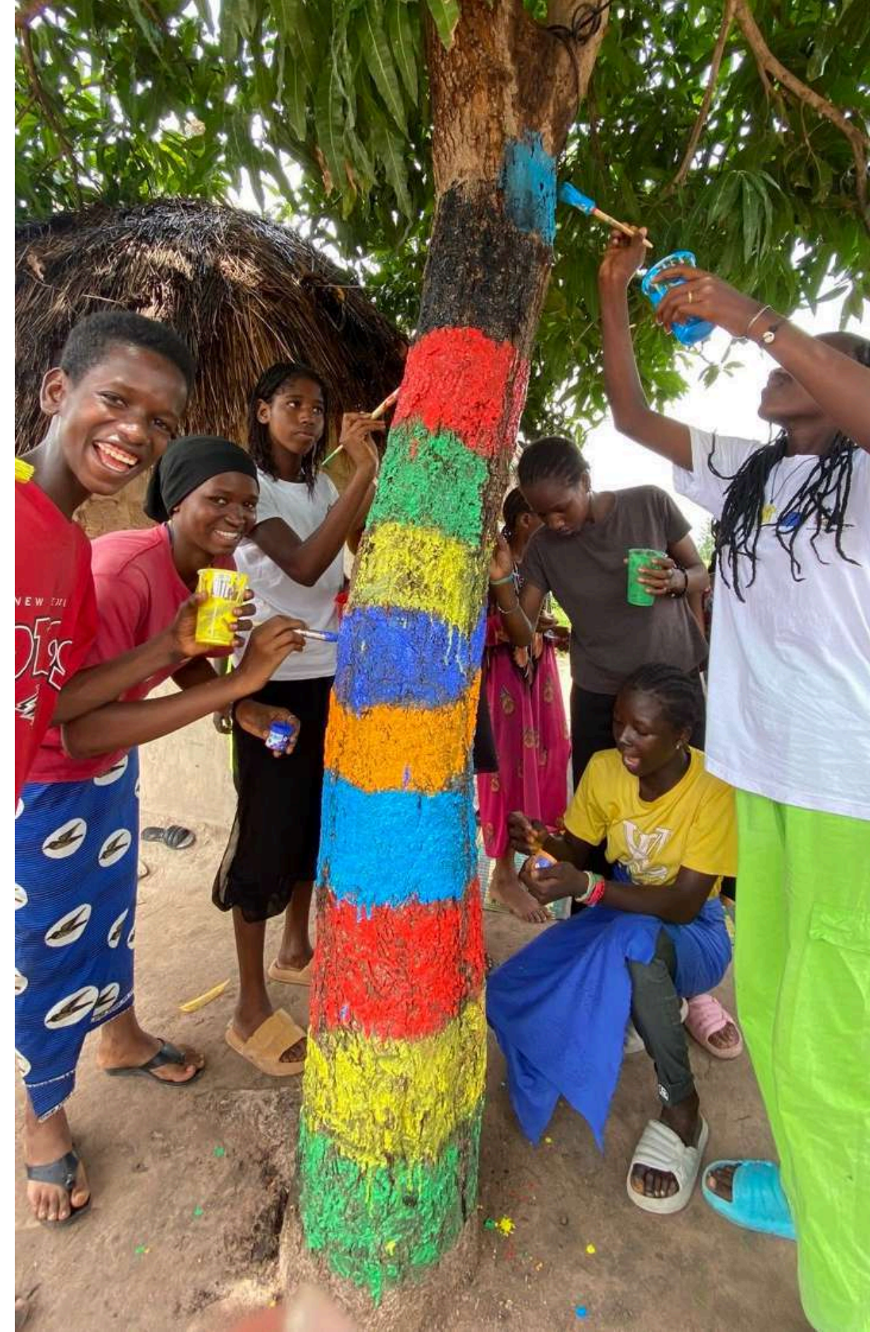
l'arbre de la comunitat, el centre de la comunitat